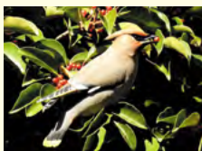
キレンジャク(尾の先端が黄色)