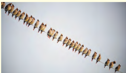
電線にとまるヒレンジャク

夏場は、シベリアやカムチャッカ半島などで繁殖し、秋の深まりとともに飛来します。繁殖地では、昆虫類もかなり食べますが、越冬地の日本では、果実や木の実を主食としています。その木の実を食べ尽くすと生活場所を移動していきます。越冬地では両種ともに群れて暮らし低地の雑木林や農耕地、都市部の一般家庭の庭先にも姿を見えます。この地域では美濃加茂市の太田宿がバードには知られており、このヤドリギを食べつくすと桃花台の公園や家庭の庭、市民四季の森、小牧山などへも飛来しクログアノモチの実を食べることもあります。