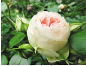
今回使用するバシュミナ

今回は、花持ちが良く病気にも強い、カップ咲きの小ぶりの花が房になって咲くバシュミナという品種を使用して、初心者でもバラ栽培が楽しめるよう鉢植えで実践します。