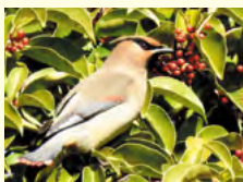
ヒレンジャク(尾の先端が赤色)