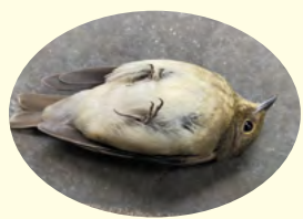
窓ガラスに衝突し気絶したコサメビタキ