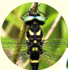
エメラルドグリーンの複眼

オニヤンマは北海道から沖縄まで日本全国の里山の水辺などに広く分布しています。国内において最大のトンボであり、その体長は約十センチ、腹長でも七センチに及びます。大きいだけに、幼虫から成虫になるまで二・三年もかかるそうです。ふれあいの森では初夏から秋の半ばの六月から十月に、遊歩道をゆうゆう