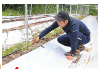
自然薯畑の草むしり。秋に収穫時期を迎えます。