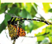
チョウを捕食するオニヤンマ