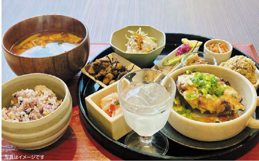
写真はイメージです

今回からは、栄養バランスの良い食事をとるために取り入れたい食材・7品目の頭文字をとってできた言葉『まごわやさしい』を使った健康料理を紹介していきます。偏りのない食事で健康維持と増進を心がけましょう。