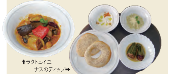
↑ラタトゥイユ ナスのディップ