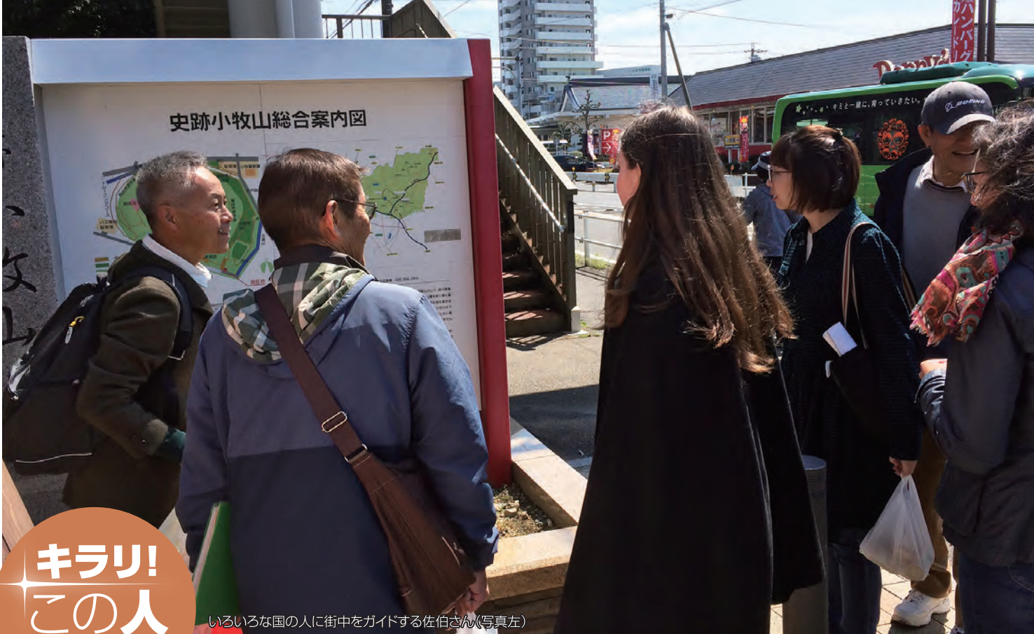
史跡小牧山総合案内図