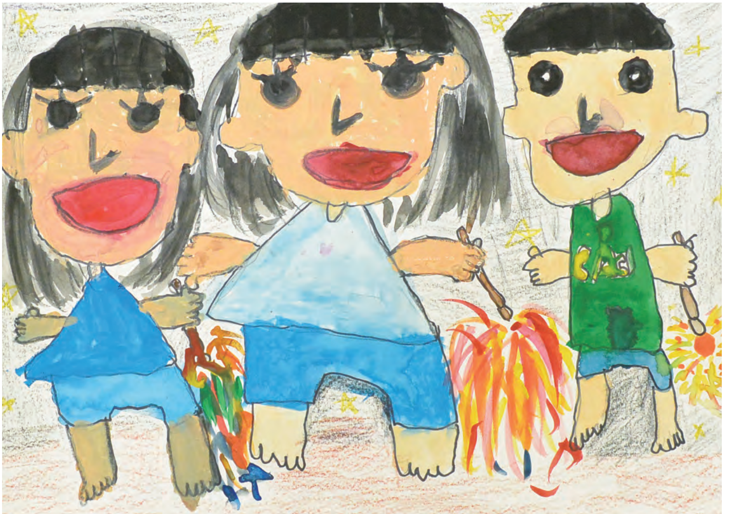
平成28年度 絵画コンクール 金賞受賞作品 波多野里桜さん(あおぞら幼稚園 年長) ※学年は受賞時のものです。