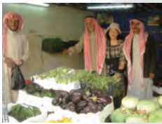
↑シリアの八百屋。たくさんのナスが売られています。