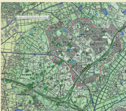
篠岡古窯跡群分布図 上:大正九年 下:現在

に測量して明治二五年に発行された五万分の一地形図「名古屋北部」、大正九年(一九二〇)に測量して大正二三年に発行された二万五千分の一地形図「小牧」が一番古い地形図です。 私が、桃花台ニュータウン関連の発掘調査を担当したときは、造成工事での発見が多く、本来の地形は全く想像もできない状態でした。そこで、旧版地図を使って、遺跡当時の地形を読み取るうとするわけです。当時は、現在の地図と旧版地図の縮尺が同じになるように、トレーシングペーパーに拡大・縮小コピーをして、重ね合わせて読み取っていましたが、現在は、ITCの進歩で、無料の地図ソフトでも、これらの重ね合わせが簡単にできるようになりました。 地図ソフトを利用して、篠岡古窯跡群の窯跡の分布図を現在の地形図と大正九年測量の地形図で作成してみました。旧版地図でないと、どんな地形のところに窯跡が作られたのか、全く分かりません。考古学の調査では、旧版地図の活用は、有効な手段のひとつです。