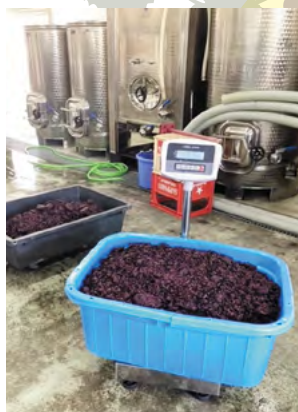
▲大量のワインパミス