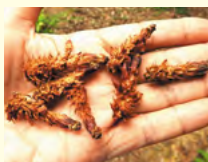
▲リスのエビフライ