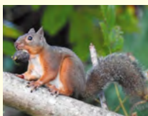
▲クルミを食べるリス

スリ)、イタチ、ノネコ、ヘビなどがいます。クルミを好み、固い殻も器用に開けることができます。他にもマツボックリやどんぐりなどをよく食べています。ニホンリスがクルミやマツボックリを食べると特徴的な食べた痕「食痕」が残るため、近くでニホンリスが活動していることが分かります。ニホンリスがいる森が秋になると、マツの木の下にエビフライのような形をしたものが落ちていたりすることがあります。これを自然観察会では「リスのエビフライ」と紹介しています。もしリスのエビフライを見つけたら近くの木を観察してみましよう。ニホンリスが見つかるかもしれませんよ。ニホンリスが生息する身近な森を大切にしなければいけませんね。