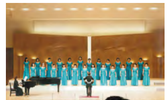
以前の発表会の様子。今年の小牧市民音楽祭は7月14日(日)、東部市民センターで行われます。

洋裁が得意な人は、発表会の衣装を作り、絵を描くのが好きな人は、プログラムを作ります。コサージュを作ったり、ステージを演出する小道具を作ったりと、本来の活動以外にも個性が光る人たちが在籍しています。また、新しい仲間も随時募集しています。合唱に興味のある人なら大歓迎だそうです。