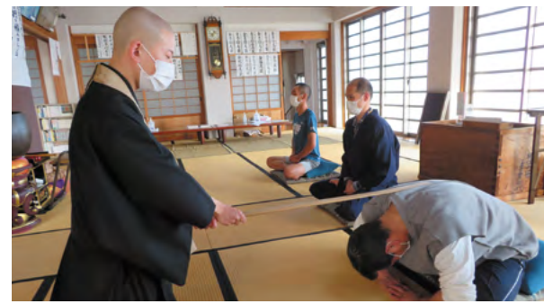
坐禅の様子。肩を叩くのは希望者のみだそうです。