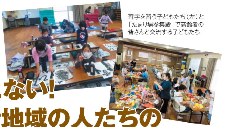
習字を習う子どもたち(左)と「たまり場参集殿」で高齢者の皆さんと交流する子どもたち