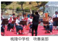
桃陵中学校 吹奏楽部

「桃花台を考える会」では、私たちが住むこのまちを「音楽のまち桃花台」として盛り上げようと活動してきました。今回は高齢化が進むこのまちが、次代を担う中学生たちから、たくさんの「元気をもらおう」コンサートを目指して、「桃陵中音楽まつり実行委員」の皆さんとともに音楽まつりを企画しました。