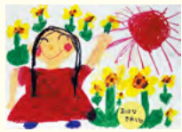
にわしのさん 名北セブンス幼稚園 年長

桃花台センターが主催する令和5年度地域交流事業「絵画コンクール」において、たくさんの応募作品の中から金賞を受賞された3作品を紹介します。