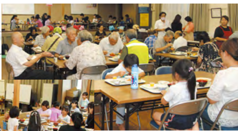
8月25日に初めて開催された地域こども食堂の様子。世代を超え皆が集まり楽しむ雰囲気がいいですね