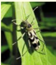
エグリトラカミキリ ふれあいの森

や土の中のミミズなどを食べます。その際、ダンスをするように体を揺らすことを愛鳥ファンはトラダンスと呼んでいます。 もう一つが昆虫の「トラフカミキリ」の仲間。写真は「エグリトラカミキリ」。胸部は黒色、上翅は灰色で黒い紋がある小さなカミキリムシ。胸部には細かい毛がはえています。 成虫は、コナラ、クスギ、ヌルデ、フジなどの倒木や伐採木で多く見られます。幼虫はこれらの枯れ木を食べています。カミキリムシの幼虫は植物の幹の中を食ベトンネルのような細長い穴を開けてしまうことからテッポウムシと呼ばれています。