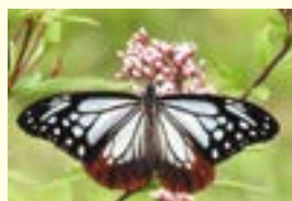
フジバカマで蜜を吸うアサギマダラ(市民四季の森)

この蝶は長距離の渡りをするので知られています。マーキング調査によると信州から台湾まで約二千里を旅した蝶もいました。小さな体の蝶が