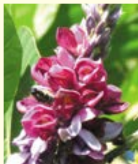
クスの花(ふれあいの森)

二千里もの距離をどうして飛ぶことができたのでしょうか。蝶をはじめ昆虫は変温動物のため上昇すると気温が下がり仮眠状態になります。そのまま風に乗り滑空していくと次第に高度が下がり気温とともに体温が上昇し、仮眠から覚めた蝶は花の蜜を吸い栄養補給をします。これを繰り返すことにより、長い距離を旅することが可能になります。