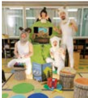
テーブルシアター