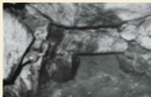
北新池古墳石室内部