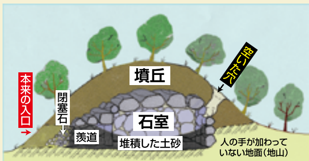
北新池古墳模式図(想像図)

以前は、石室の奥に穴が開き、内部へ入ることができました。ここへ初めて調査に入ったのは、昭和五年だったと思います。やっと通り抜けられる狭い穴から石室内に入ったのですが、真つ暗な石室内が酸欠になっていたのか、何か潜んでいないか、ずいぶん怖