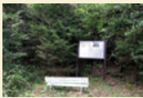
北新池古墳(ふれあいの森)