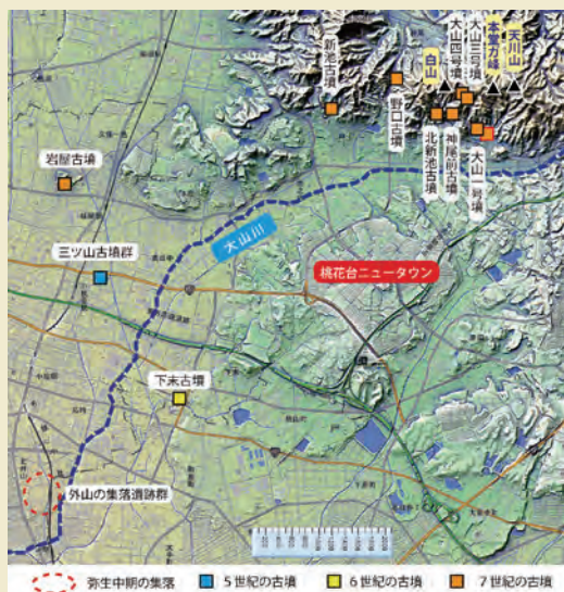
小牧市東部の古墳分布