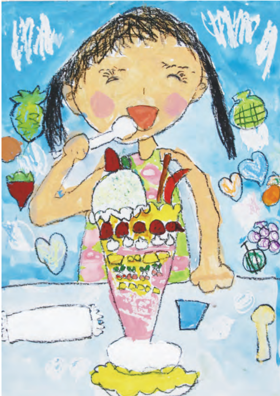
平成29年度 絵画コンクール金賞受賞作品 坂本柑奈さん(あおぞら幼稚園 年長) ※学年は受賞時のものです。