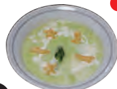
↑ほうれん草のグリーンスープ = フランス