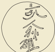
桃山4号窯「三家人狄雄」刻書