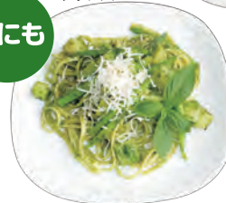
←ルッコラとバジルのスパゲティ = イタリア