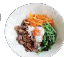
↑小松菜のピビンバ = 韓国